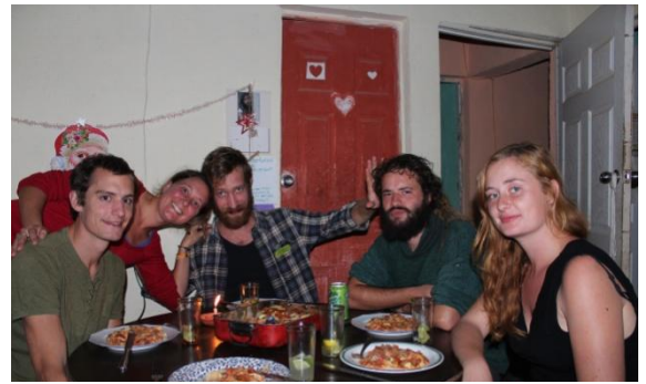
De twee teams genieten van een heerlijke kerstlasagne in Pojom!

Kerstmis werd gevierd in Pojom, inclusief een prachtoptreden van een lokale groep muzikale jongelingen en een gedenkwaardig goeie lasagna én rozijnenbrood! Voor nieuwjaar was het in Yalanhuitz te doen, met een heus tuinfeest in een op scoutswijze gesjord vrachtwagenzeil. Opmerkelijk was dat het tijdens de feestdagen dit jaar rustig is gebleven, in tegenstelling tot het vorige. Wat wel met meer rumeur is gebeurd deze keer, was de wissel naar de nieuwe burgemeester. Deze laatste had een internationaal befaamde marimbaband uit Santa Eulalia laten aanrukken, die heel het dorp op 30 uur lang oorverdovende muziek trakteerde.