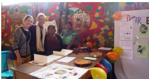
Team Vivir en Amor is er klaar voor!