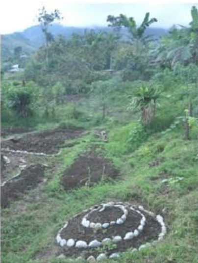
De tuin in aanleg met kruidenspiraal.

Het terrein achter de kliniek in Yalanhuitz wordt een paradijs!