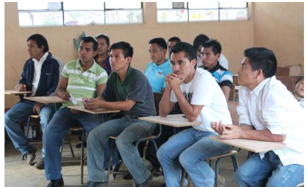
Brainstormen over de toekomst van het onderwijs in Pojom..

In 2013 zijn er 7 studenten van AMERG als leerkracht lager onderwijs afgestudeerd. Zij kunnen nu gaan lesgeven of ervoor opteren om nog verder te studeren. Ook de officiële bachillercursus bereidde 6 studenten voor op universiteitsstudies. Samen met de studenten die in Barillas en San Mateo hun perito, diversificado of bachiller beëindigden, staat de teller op 20 studenten die aan de universiteit kunnen starten, een drietal zal in 2014 aan hun tweede jaar beginnen. Dat is al heel wat, maar nog niet genoeg om hier een campus te krijgen.