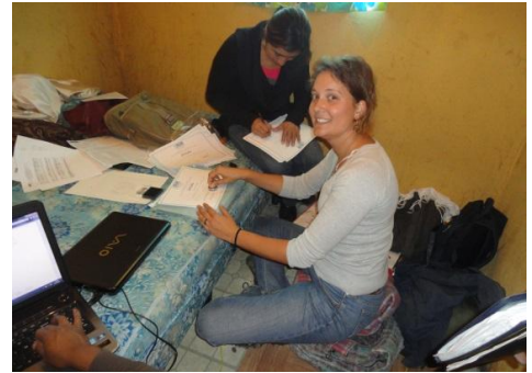
Druk aan het werk met de papierwinkel!

Tegen het eind van oktober moesten de schoolpapieren binnen bij de algemene administratie (CTA = Coordinación Técnica Administrativa). Hilarisch hoe men dan met pc's en printers op de bus stapt naar San Mateo Ixtatán, daar hotelkamers huurt om alles wat bij nazicht fout blijkt te zijn, ter plekke in orde te brengen. Handtekeningen in het zwart of blauw, een lijntje dat niet volledig doorgetrokken is, leerlingen die blijkbaar toch niet ingeschreven staan in het systeem... zijn enkele van de fouten waardoor sommige zaken meermaals geprint moeten worden. Een hele belevenis, maar ze slaan zich er door met de middelen die ze hebben.