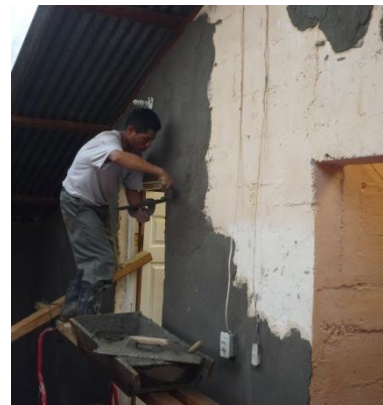
De albañil aan het werk met de bezetting...