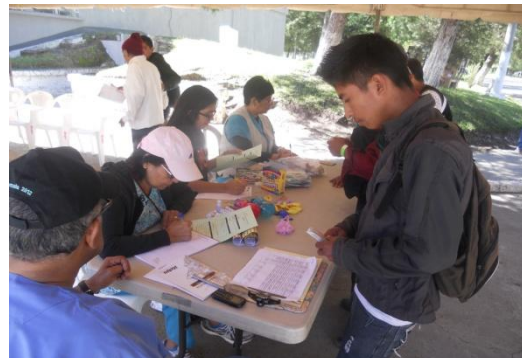
De patiënten moeten eerst ingeschreven worden voor een operatie bij de juiste dokter.