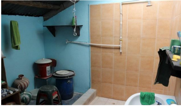
De badkamers werden herschilderd en de douche werd betegeld, zodat het vocht niet in de muur kan trekken.