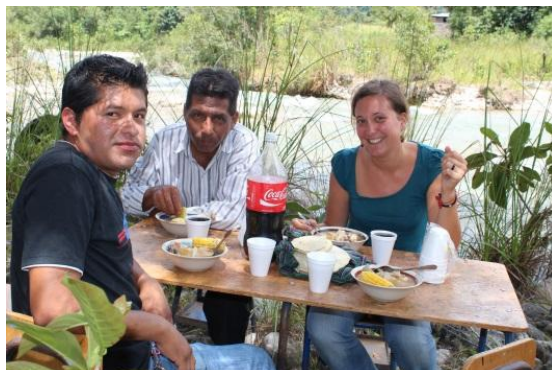
... en genieten van een lekkere caldo de pollo!