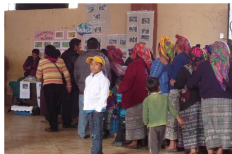
De horde vrouwen begint aan hun ronde langs de verschillende informatieve standjes.

De voedingsbeurs richtte zich in de eerste plaats op de ouders van ondervoede kinderen uit de regio San Mateo Ixtatan. Elke organisatie kreeg een standje toegewezen dat ze naar eigen keuze mocht invullen met informatieve pamfletten of met het aanbieden van proevertjes. Verschillende organisaties hadden gezonde en voedzame gerechten klaargemaakt waarvan de ouders konden proeven en waarbij info werd gegeven over welke groenten, meestal lokale groenten uit de eigen gemeenschap, ze hiervoor nodig hadden. Zo werden ze aangezet om zelf op zoek te gaan naar voedzame gerechten die ze met de groenten uit hun eigen gemeenschap konden maken. Ook kregen de ingeschreven bezoekers aan het einde van de beurs een voedingspakket mee naar huis.