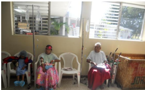
Enkelen van onze patiënten wachten geduldig hun beurt af voor hun operatie...

Eind september was het weer zover, het halfjaarlijkse evenement van een groep Amerikaanse dokters die gratis opereren in de militaire zone van Huehuetenango. Voor ons de ultieme kans om patiënten een extra dienst aan te bieden. De twee clinicas hadden deze keer samen 12 patiënten op de lijst staan voor consultaties en operaties.