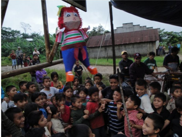
De piñata die een massa kinderen lokt.