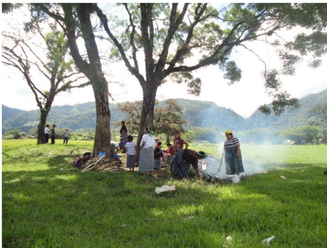
De kokende moeders.

Op 15 oktober werd het schooljaar afgesloten met een feestelijke dag in Ixquisis: eerst de wandeling ernaartoe, dan een voetbaltoernooi tussen de verschillende lokale ploegen en dan een heerlijk middagmaal bereid door enkele moeders. Het was prachtig weer en een heel mooie en gezellige afsluiter van het schooljaar.