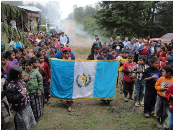
Officiële opening van de kliniek.

de traditionele vroedvrouwen. Aangezien een groot deel van hun werking aansluit bij die van ons gaan we zeker proberen samenwerken met de kliniek in Xapper.