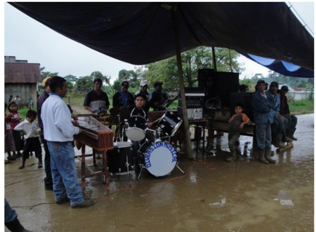
De marimband die het hele gebeuren opluistert vanop het basketbalveldje.