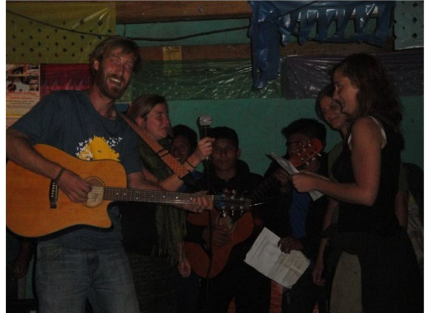
Vrijwilligers van Yalanhuitz en het clinica lied.