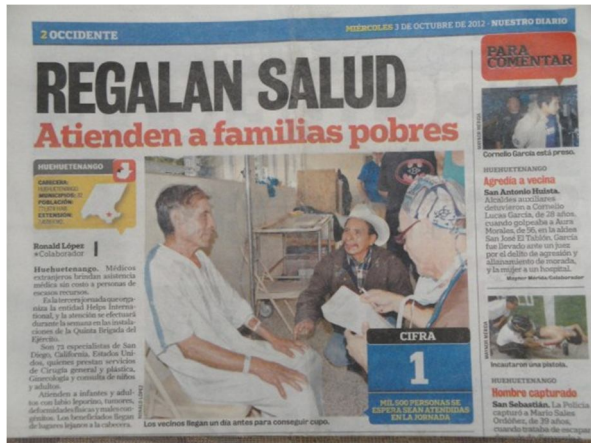
Foto van onze patiënt in Nuestro Diario.

Begin oktober was het weer zo ver: een nieuwe Jornada van HELPS, een Amerikaanse organisatie van dokters en specialisten die een week lang hun tenten opslaan in Huehuetenango om er gratis patiënten te opereren. In Pojom en Yalanhuitz waren er samen 11 patiënten. Ze werden allemaal onderzocht, doorverwezen en 3 van hen werden geopereerd. Na 2 dagen recupereren mochten ze alle 3 gezond en wel naar huis. De patiënt uit Pojom eindigde zelfs in de lokale krant!