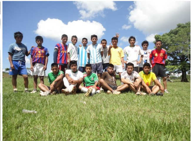
Het voetbalteam van de jongens.