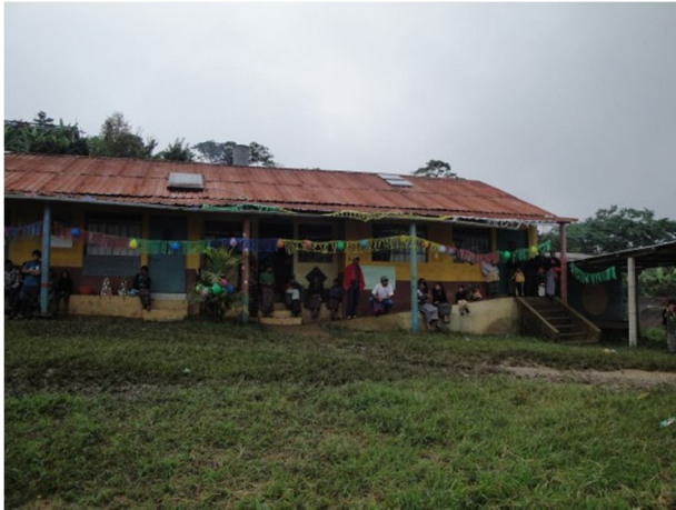
De feestelijk versierde clínica.