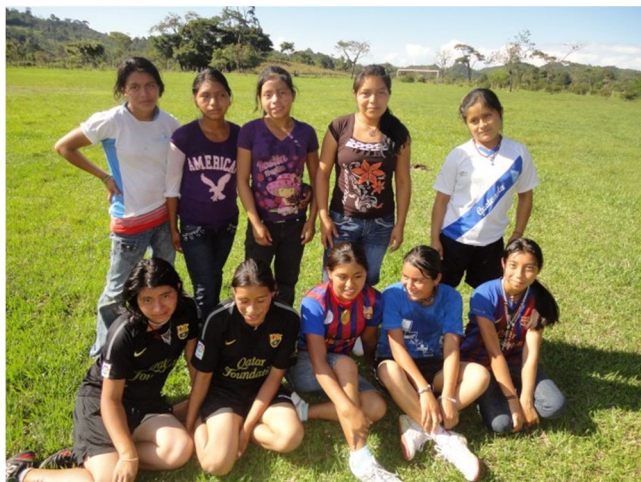
Het team van de meisjes.