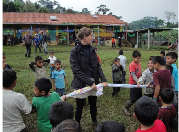
Touwtrekken, een groot succes.